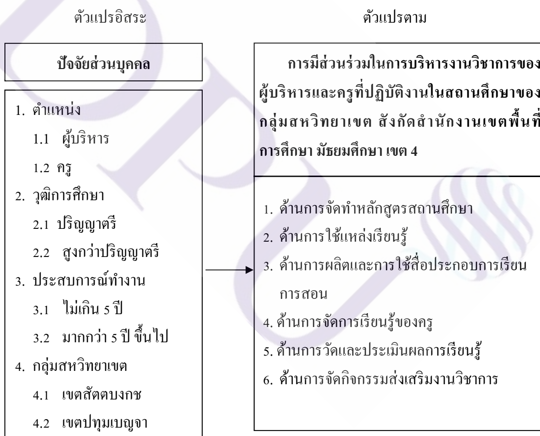
ภาพที่ 1.1 กรอบแนวคิดในการวิจัย

มาตรฐาน รักษามาตรฐาน และพัฒนาสู่ความเป็นเลิศ ซึ่งมีความสอดคล้องกับพระราชบัญญัติ การศึกษาแห่งชาติ พ.ศ. 2542 แก้ไขเพิ่มเติม (ฉบับที่ 2) พ.ศ. 2545 และกฎกระทรวงว่าด้วยระบบ หลักเกณฑ์และวิธีการประกันคุณภาพการศึกษา พ.ศ. 2553 ข้อ 38 ซึ่งกำหนดให้ สมศ.ทำการ ประเมินคุณภาพภายนอกสถานศึกษาแต่ละแห่งตามมาตรฐานการศึกษาของชาติ และครอบคลุม หลักเกณฑ์เรื่องต่อไปนี้เป็น มาตรฐานว่าด้วยผลการจัดการศึกษาในแต่ละระดับและประเภท การศึกษามาตรฐานที่ว่าด้วยการบริหารจัดการศึกษา มาตรฐานที่ว่าด้วยการจัดการเรียนการสอนที่ เน้นผู้เรียนเป็นสำคัญและมาตรฐานที่ว่าด้วยการประกันคุณภาพภายในจากกลุ่มตัวบ่งชี้ของ สมศ. ผู้วิจัยได้ทำการศึกษาและนำตัวบ่งชี้ทั้งหมด มาทำการคิดเชิงสังเคราะห์โดยการรวมตัวบ่งชี้ทั้งหมด เข้าด้วยกัน และนำมากำหนดเป็นกรอบแนวคิดในการศึกษาของผู้วิจัยเอง ดังนี้