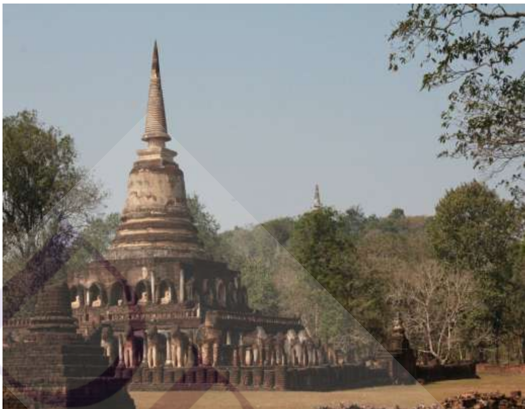
ภาพที่ 2.2 อุทยานประวัติศาสตร์ศรีสัชนาลัย วัดช้างล้อม

อุทยานประวัติศาสตร์ศรีสัชนาลัย ประมาณ 28,217ไร่ 27 ประกอบด้วยเมืองศรีสัชนาลัย และเมืองเชลียง (พุทธศตวรรษที่ 18-21)บริเวณที่ราบริมน้ำยมและที่ลาดเชิงเขาพระศรี เขาใหญ่ เขาสุวรรณคีรี เขาพนมเพลิง เป็นพื้นที่ซึ่งเหมาะแก่การตั้งถิ่นฐาน เนื่องจากมีแม่น้ำและภูเขาเป็นปราการล้อมรอบ ประกอบกับความอุดมสมบูรณ์จากแม่น้ำยมและคลองเล็กคลองน้อยที่ไหลเชื่อมโยงในพื้นที่ ทำให้มีชุมชนก่อตัวขึ้นบริเวณนี้ตลอดมา จากหลักฐานที่พบ เช่น ขวานหินขัด ที่บ้านท่าชัย ตำบลท่าชัย อำเภอศรีสัชนาลัย ในตัวเมืองโบราณศรีสัชนาลัย และที่บริเวณเขาเขน-เขากา อำเภอศรีนคร ทำให้ทราบว่า บริเวณเมืองศรีสัชนาลัยมีการตั้งถิ่นฐานมาอย่างต่อเนื่อง นอกจากนี้ บริเวณโดยรอบยังปรากฏร่องรอยของชุมชนก่อนประวัติศาสตร์ในสังคมเกษตรกรรมที่รู้จักเพาะปลูก เลี้ยงสัตว์ และดำรงชีวิตบนพื้นราบริมน้ำเป็นหลักแหล่งด้วย อย่างไรก็ตาม จากการขุด