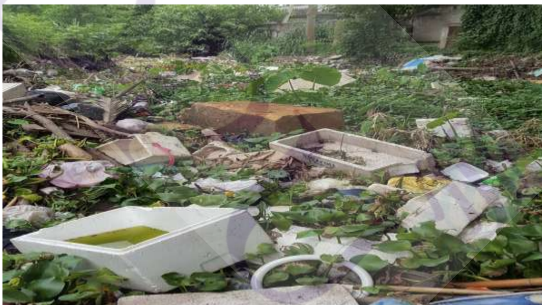
ภาพที่ 4.3 ภาพสภาพปัญหาขยะในคลองแม่ข่า จังหวัดเชียงใหม่

ตัวอย่างปัญหาขยะในคลองแม่ข่า จังหวัดเชียงใหม่ โดยที่คลองแม่ข่าถือว่าเป็นหนึ่งใน ไชยมงคลเจ็ดประการของการเลือกพื้นที่ในการสร้างเมืองเชียงใหม่โดยพญามังราย เมื่อปี พ.ศ. 1839 มีความสำคัญในทางยุทธศาสตร์ในฐานะเป็นคูเมืองชั้นนอกของเมืองเชียงใหม่ทางด้านตะวันออก และด้านใต้ ในอดีตได้เอื้อประโยชน์อย่างใหญ่หลวงในด้านการระบายน้ำจากเขตเมืองสู่แม่น้ำปิง เป็นแหล่งน้ำใช้เพื่อเกษตรกรรม การอุปโภคบริโภค และการสัญจรทางน้ำ เอื้อต่อวิถีวัฒนธรรม ตลอดจนการดำเนินชีวิตของชาวเมืองเชียงใหม่มาช้านาน 4 จึงถือเป็นคลองในประวัติศาสตร์อันเป็น มรดกทางวัฒนธรรม ซึ่งปัญหาน้ำเน่าเสียที่ถูกระบายลงในคลองแม่ข่า การทิ้งขยะลงในคลองแม่ข่า ทำให้ส่งผลกระทบต่อภาพลักษณ์ในการอนุรักษ์วัฒนธรรมไทย จึงมีโครงการเพื่อพลิกฟื้นคลอง แม่ข่าขึ้นเพื่อให้น้ำในคลองดีขึ้นและอนุรักษ์ความเป็นประวัติศาสตร์ของคลองแม่ข่าต่อไป