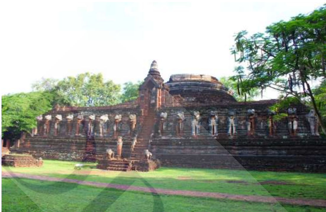
ภาพที่ 2.4 อุทยานประวัติศาสตร์กำแพงเพชร วัดช้างรอบ

2) โบราณสถานนอกกำแพงเมือง หรือเขตอรัญญิกเช่น วัดพระสี่อิริยาบถ วัดพระนอน วัดช้างรอบ และวัดอวาตาสใหญ่ เป็นต้น 31