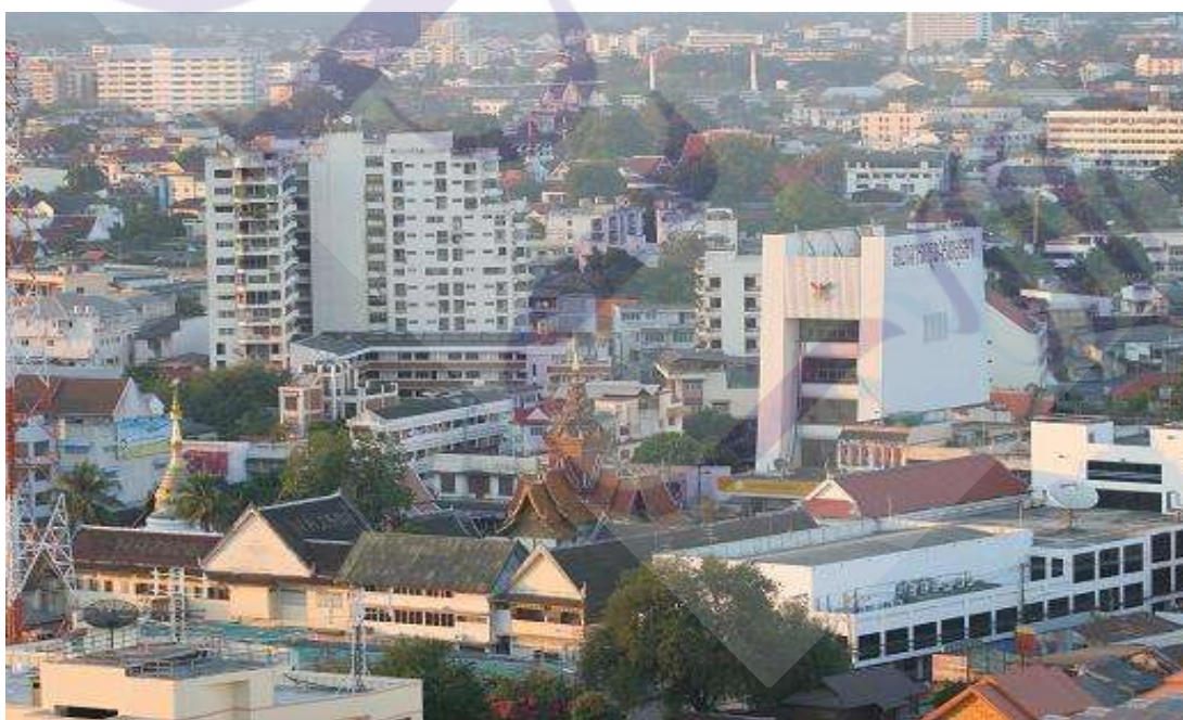
ภาพที่ 4.1 สภาพปัญหาอาคารสูงกับวัดในจังหวัดเชียงใหม่

ไม่ให้กระทบต่อมรดกโลก ในเมืองเชียงใหม่ โดยลักษณะกายภาพของโบราณสถานในจังหวัดเชียงใหม่ มักจะกระจายตัวอยู่รอบๆเขตเมืองโดยมีชุมชน อยู่ล้อมรอบ กรณีนี้การบริหารจัดการมรดกโลกในจังหวัดเชียงใหม่จึงต้องมีการปรับปรุงภูมิทัศน์ ให้โดยอำนาจของกรมศิลปากรและองค์การปกครองส่วนท้องถิ่นในการสอดประสานร่วมมือ ไม่ว่าจะเป็นการให้ความรู้แก่ประชาชนในเรื่องการวางแผนอนุรักษ์มรดกโลกในชุมชน การบังคับใช้กฎหมายอย่างมีประสิทธิภาพ ปัญหาเรื่องกฎหมายผังเมือง และกฎหมายควบคุมอาคาร โดยเฉพาะการมีการก่อสร้างอาคาร โดยมีผลกระทบต่อสถาปัตยกรรมอันเป็นมรดกโลกทางวัฒนธรรม และการก่อสร้างที่สูงเกินกว่ากำหนดภายในตัวเมืองเชียงใหม่ การสร้างอาคารที่สีฉูดฉาดมากเกินไป การกำหนดผังเมืองมีกฎกระทรวง ให้ใช้บังคับผังเมืองรวมเมืองเชียงใหม่ พ.ศ. 2555 มีวัตถุประสงค์หลักที่เกี่ยวข้องกับมรดกโลกทางวัฒนธรรม กล่าวคือส่งเสริมและอนุรักษ์ศิลปวัฒนธรรมและสภาพแวดล้อมที่มีคุณค่าทางศิลปกรรม สถาปัตยกรรม ประวัติศาสตร์ และโบราณคดี ให้เป็นเอกลักษณ์ของจังหวัดเชียงใหม่ แม้มีกฎหมายประกาศใช้แล้วแต่การบังคับใช้ของเจ้าพนักงานก็ยังขาดประสิทธิภาพ ทำให้เมืองเชียงใหม่เติบโตอย่างไร้ทิศทาง