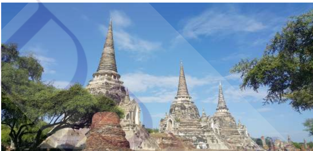
ภาพที่ 2.6 อุทยานประวัติศาสตร์อโยธยา