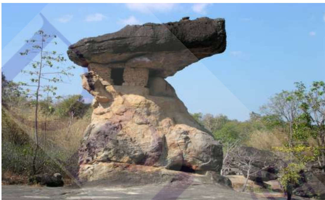
ภาพที่ 2.11 ภาพอุทยานประวัติศาสตร์ภูพระบาท

บารส” เป็นส่วนใหญ่ อาทิ หอนางอุสา กุ๋นางอุสา บ่อน้ำนางอุสา วัดลูกเขย วัดพ่อตา คอกม้าทำวบา รส ทั้งนี้ อุทยานประวัติศาสตร์ภูพระบาทมีลักษณะที่แตกต่างจากอุทยานประวัติศาสตร์แห่งอื่นๆ ของกรมศิลปากรที่ได้กล่าวมาแล้ว เพราะนอกจากจะมีความสำคัญทางประวัติศาสตร์โบราณคดี แล้ว ยังมีความสำคัญทางด้านนิเวศวิทยา เนื่องจากเป็นที่ตั้งของวนอุทยานภูพระบาทบัวบกของกรม ป่าไม้ ซึ่งมีพืชพรรณทั้งไม้ดอกและไม้ใบจีนอยู่เป็นจำนวนมาก 46