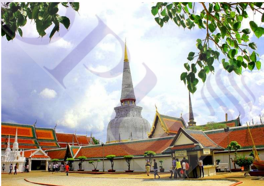
ภาพที่ 2.10 วัดมหาธาตุวรมหาวิหาร