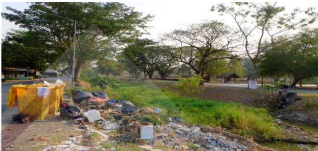
ภาพที่ 4.5 ภาพปัญหาขยะกับมรดกโลก จังหวัดพระนครศรีอยุธยา

ของท้องถิ่น ไม่มีประสิทธิภาพตามกฎหมาย ข่มขู่ส่งผลให้เกิดปัญหา เช่น ปัญหาเรื่องขยะ น้ำเสียในคูเมือง เป็นต้น