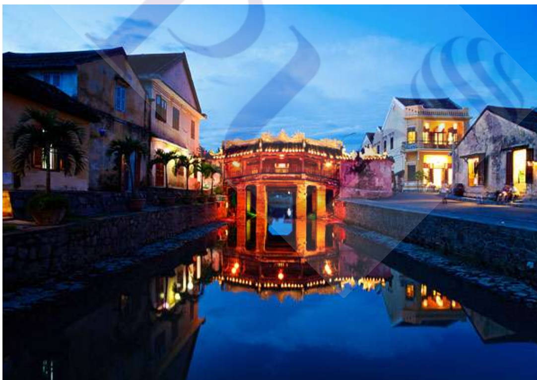
ภาพที่ 4.7 มรดกโลกเมืองโบราณฮอยอัน สาธารณรัฐสังคมนิยมเวียดนาม

หลังจากได้มีการกำหนดผังเมืองแล้วเทศบาลของเมืองฮอยอันได้จัดหมวดหมู่ของสิ่ง ปลูกสร้างภายในเมืองโบราณฮอยอัน ย่อมส่งผลดีให้เป็นไปได้ตามหลักการบริหารในการดูแลอาคาร ดังกล่าว รวมถึงชุมชนโดยรอบ โดยไม่กระทบต่อการเป็นมรดกโลกทางวัฒนธรรม