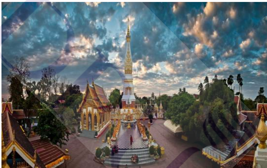
ภาพที่ 2.12 ภาพพระธาตุพนมรวมมหาวิหาร

พระอรรคชาตุมาบวชจนบรรลอรหันต์ครั้งนอรหันต์ทั้งห้าระลึกชาติได้จึงปรารถนาที่จะ สร้างองค์พระธาตุพนมจึงไปขอความอุปถัมภ์จากพญาสุมิตรธรรมวงศา เจ้าเมืองมรุกขนคร ซึ่งเป็น ชาติกำเนิดใหม่ของพญาศรีโคตรบูร จึงได้ร่วมกันก่อสร้างและ สถาปนาพระธาตุพนม โดยหลังจาก สถาปนาแล้วพญาสุมิตรธรรมวงศาได้ให้บริวาร จำนวน 3,000 คนไว้เป็นข้าทาสบริวารจนเกิดเป็น ชุมชนพระธาตุพนมตั้งแต่นั้นมา