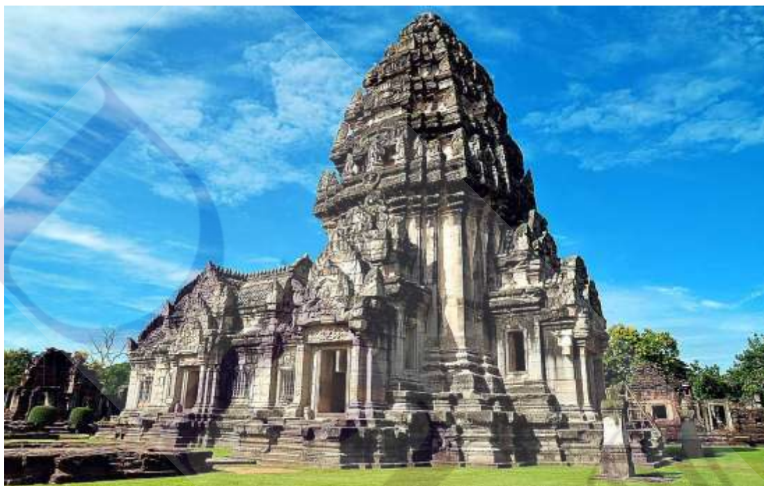
ภาพที่ 2.9 ปราสาทหินพินาย

พินาย น่าจะมาจากคำว่าวิมายหรือวิมายปุระ ที่ปรากฏในจารึกภาษาขอมบนแผ่นหิน ตรงกรอบประตูระเบียงคดด้านหน้าของปราสาท จากหลักฐานศิลาจารึกและศิลปะสร้างบ่งบอกว่า ปราสาทหินพินายคงเริ่มสร้างขึ้นสมัยพระเจ้าสุริยวรมันที่ 1 ราวพุทธศตวรรษที่ 16 ในฐานะเทวสถานของศาสนาพราหมณ์ รูปแบบของศิลปะเป็นแบบบาปวนผสมผสานกับศิลปะแบบนครวัด ซึ่งหมายถึงปราสาทนี้ได้ถูกดัดแปลงมาเป็นสถานที่ทางศาสนาพุทธในสมัยพระเจ้าชัยวรมันที่ 7 41