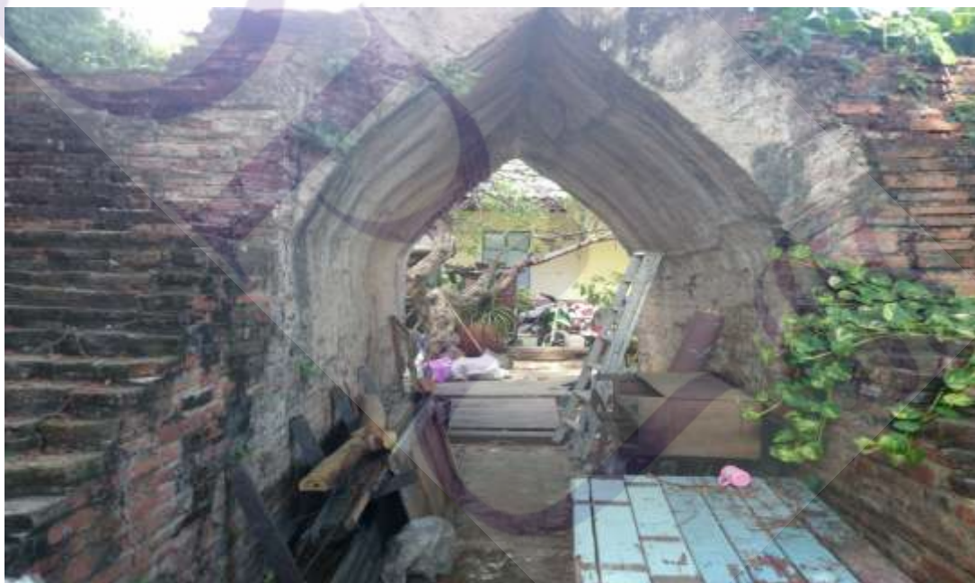
ภาพที่ 4.4 ภาพช่องกุด จังหวัดพระนครศรีอยุธยา

ตัวอย่างปัญหาในอุทยานประวัติศาสตร์พระนครศรีอยุธยา การก่อสร้างทับซ้อนโบราณสถานย่านการค้าโบราณ แนวถนนและคูคลองโบราณ การต่อเติมร้านค้าและตัดแปลงเป็นที่อยู่อาศัย ซึ่งส่งผลต่อมรดกโลกโดยตรง เป็นต้น