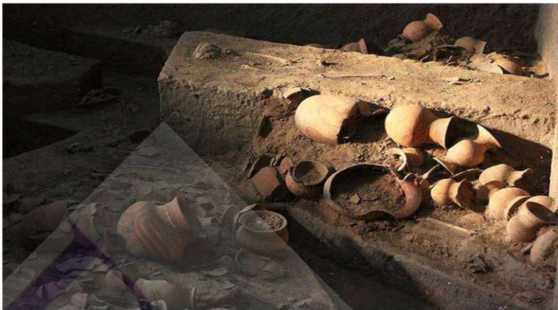
ภาพที่ 2.7 แหล่งโบราณคดีบ้านเชียง

ที่มา: มรกต นาคสวาท จาก www.bloggang.com