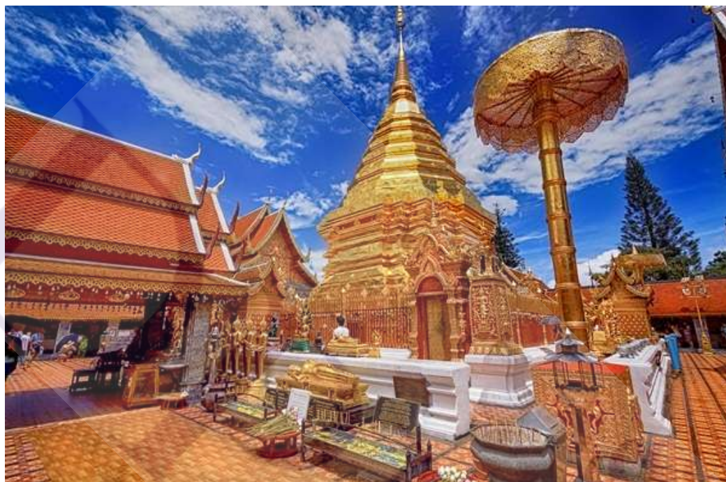
ภาพที่ 2.8 วัดพระธาตุดอยสุเทพ จังหวัดเชียงใหม่

สนใจศึกษาพระพุทธศาสนาเป็นอย่างมาก สมัยพระเจ้าติโลกราช กษัตริย์องค์ที่ 9 อาณาจักรล้านนา ได้ขยายออกไปอีกอย่างกว้างขวางพร้อมกับได้ผูกสัมพันธ์ไมตรีกับสมเด็จพระบรมไตรโลกนาถ แห่งกรุงศรีอยุธยา ซึ่งสมัยของพระเจ้าติโลกราชนี้เองที่ได้มีการสังคายนาพระไตรปิฎกขึ้นเป็นครั้งแรกในประเทศไทย