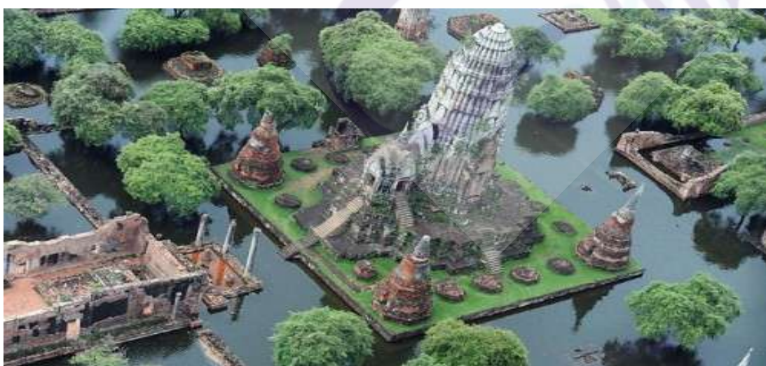
ภาพที่ 4.6 ปัญหาน้ำท่วมมรดกโลก ปี พ.ศ. 2554 จังหวัดพระนครศรีอยุธยา

อีกทั้งปัญหาความเสียหายจากการถูกอุทกภัยในจังหวัดสุโขทัยและจังหวัดพระนครศรีอยุธยา โดยเฉพาะที่อุทยานประวัติศาสตร์พระนครศรีอยุธยาที่ได้รับผลกระทบหนักที่สุดเมื่อครั้งน้ำท่วมใหญ่ ปี พ.ศ.2554