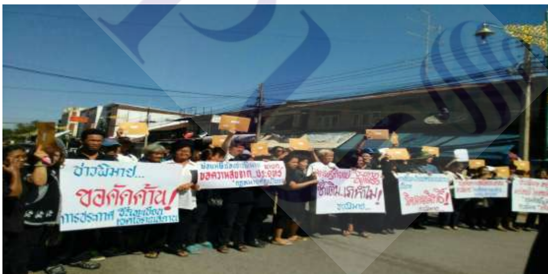
ภาพที่ 4.2 ภาพการเรียกร้องของชาวพิมายจากปัญหาพื้นที่ทับซ้อนระหว่างประชาชนและภาครัฐ ที่มา: Thanongsak Hanwong

ส่วนเส้นทางวัฒนธรรมพิมาย ปราสาทพนมรุ้ง และปราสาทเมืองต่ำ เมื่อได้ขึ้นทะเบียนรายชื่อเบื้องต้น ก็มีการประชุมวางแผนในการบริหารพื้นที่โบราณสถาน ทำให้เกิดข้อพิพาทเกี่ยวกับเรื่องที่ดินทับซ้อนของเอกชนกับโบราณสถาน สืบเนื่องจาก กรมศิลปากร ได้ส่งหนังสือลงวันที่ 16 ก.ย. 2559 ถึงเจ้าของหรือผู้ครอบครองที่ดินในเขตที่ดินโบราณสถาน เมืองพิมาย 1,665 ราย แจ้งให้ทราบว่ากรมฯ ได้จัดทำแนวเขตที่ดินโบราณสถานเมืองพิมายแล้ว ครอบคลุมพื้นที่ 2,658 ไร่ (ครอบคลุมหมดทั้งเทศบาล) และหากเจ้าของที่ดินไม่เห็นด้วย ก็สามารถยื่นคัดค้านได้ภายใน 30 วัน หลังจากได้รับแจ้งจากกรมฯ ซึ่งขณะนี้ มีประชาชนได้รับหนังสือที่อธิบดีเป็นผู้ลงนามประมาณ 200-300 ราย 2 ทั้งนี้ มีการกล่าวอ้างในเหตุผลของชาวบ้านว่าได้มีการอยู่ในพื้นที่ดังกล่าวเป็นเวลานานส่วนในภาครัฐก็มุ่งในการจัดระเบียบเพื่ออนุรักษ์โบราณสถาน จึงต้องมีการทำความเข้าใจและประสานประโยชน์ในการบังคับใช้กฎหมายระหว่างเอกชนกับรัฐ