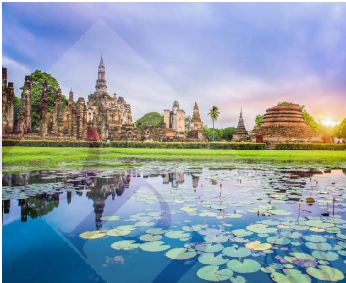
ภาพที่ 2.1 อุทยานประวัติศาสตร์สุโขทัย

วัดตะพานหิน ตั้งแต่พุทธศตวรรษที่ 16 เป็นต้นมา วัฒนธรรมแบบขอมหรือบางที่เรียกว่า“สมัยลพบุรี” ได้ปรากฏขึ้นในดินแดนสุโขทัย มีหลักฐาน คือ ปราสาทเขาปู่จา อำเภอคีรีมาศ