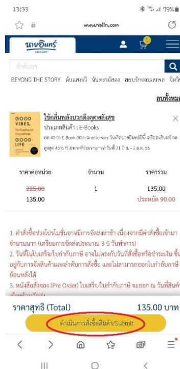
ภาพที่ 4.3 การสั่งซื้อหนังสืออิเล็กทรอนิกส์ในเว็บไซต์นายอินทร์ (NAIIN)