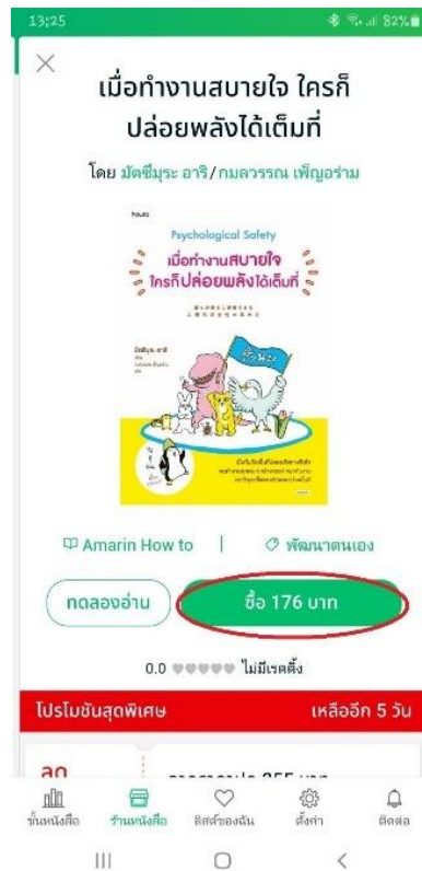
ภาพที่ 4.2 การสั่งซื้อหนังสืออิเล็กทรอนิกส์ในแอปพลิเคชัน MEB