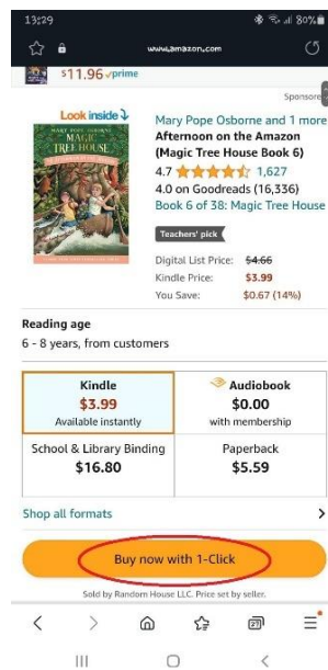
ภาพที่ 4.1 การสั่งซื้อหนังสืออิเล็กทรอนิกส์ ในเว็บ Amazon

จากการศึกษาลักษณะการได้มาซึ่งหนังสืออิเล็กทรอนิกส์ว่าเป็นการซื้อขายหรือการอนุญาตให้ใช้สิทธินั้นพบว่า การซื้อขายตามประมวลกฎหมายแพ่งและพาณิชย์ มาตรา 453 กำหนดไว้ว่า “อันว่าซื้อขายนั้น คือ สัญญาซึ่งบุคคลฝ่ายหนึ่งเรียกว่า ผู้ขาย โอนกรรมสิทธิ์แห่งทรัพย์สินให้แก่บุคคลอีกฝ่ายหนึ่ง เรียกว่า ผู้ซื้อ และผู้ซื้อตกลงว่าจะใช้ราคาทรัพย์สินนั้นให้แก่ผู้ขาย” โดยทรัพย์สินที่สามารถโอนกรรมสิทธิ์ได้นั้น หมายความรวมทั้งทรัพย์สินอันเป็นวัตถุที่มีรูปร่างและวัตถุที่ไม่มีรูปร่างซึ่งอาจมีราคาและอาจถือเอาได้ เมื่อพิจารณาความหมายของการซื้อขาย คือ ผู้ขายโอนกรรมสิทธิ์ในทรัพย์สินไปยังผู้ซื้อ โดยได้รับชำระราคาทรัพย์สินดังกล่าว และในแอปพลิเคชันเกี่ยวกับหนังสืออิเล็กทรอนิกส์ ไม่ว่าจะเป็น Amazon, Meb, Naiin, Ookbee เมื่อผู้ซื้อกดเลือกหนังสืออิเล็กทรอนิกส์แล้ว ในแอปพลิเคชันจะให้ผู้ซื้อกดดำเนินการซื้อ / Buy ทำให้ผู้ซื้อหนังสืออิเล็กทรอนิกส์เกิดความสับสนและเข้าใจว่าตนเองซื้อหนังสืออิเล็กทรอนิกส์ เมื่อเป็นการซื้อหนังสืออิเล็กทรอนิกส์ ผู้ซื้อจึงอาจมีสิทธิในการจำหน่ายต่อหนังสืออิเล็กทรอนิกส์ได้ กรณีนี้ จึงต้องพิจารณาว่า ผู้ซื้อหนังสืออิเล็กทรอนิกส์ได้มาซึ่งกรรมสิทธิ์หรือไม่