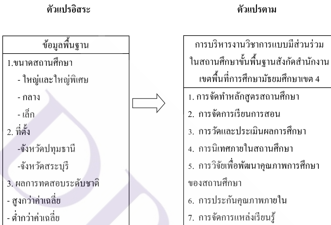
ภาพที่ 1.1 กรอบแนวคิดในการวิจัย