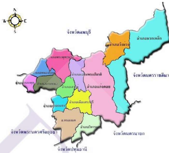
ภาพที่ 2.3แผนที่ทางการปกครองจังหวัดสระบุรี