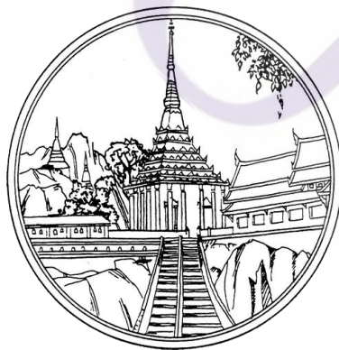
ภาพที่ 2.4 ตราสัญลักษณ์จังหวัดสระบุรี