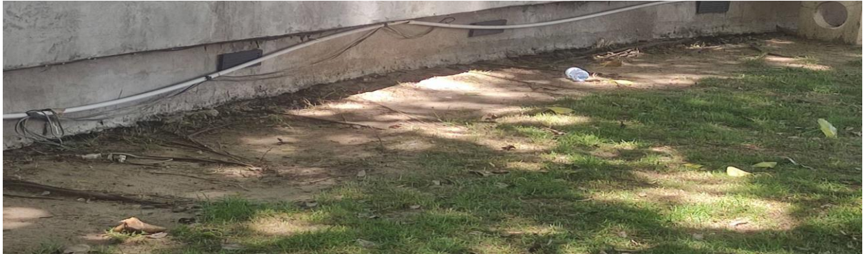
ภาพที่ 2.3 บริเวณชุมชนตลาดน้อย 1