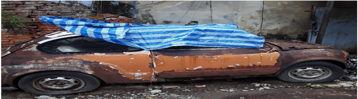
ภาพที่ 2.4 บริเวณชุมชนตลาดน้อย 2

ชื่อเสียง โบสถ์กาลหว่าร์ ศาสนสถานของศาสนาคริสต์นิกายโรมันคาทอลิก กรมเจ้าท่า และธนาคารไทยพาณิชย์ สาขาตลาดน้อย ซึ่งเป็นธนาคารแห่งแรกของประเทศไทย ตัวอาคารธนาคารเป็นสถาปัตยกรรมแบบโบซาร์ผสมนีโอคลาสสิก โดยก่อสร้างตั้งแต่ พ.ศ. 2451 ตีตริมฝั่งแม่น้ำเจ้าพระยา ปัจจุบันก็ยังคงเปิดให้บริการอยู่ ซึ่งอาคารแห่งนี้เคยได้รับรางวัลอนุรักษ์สถาปัตยกรรม ASA ในปี พ.ศ. 2525 และบูรณะปรับปรุงในปี พ.ศ. 2538 นอกจากนี้แล้วถนนเจริญกรุงในแถบนี้ในอดีตยังปรากฏร่องรอยรางของรถรางบนพื้นถนนอีกด้วย ก่อนจะถูกรื้อทิ้งด้วยยางในปลายปี พ.ศ. 2558