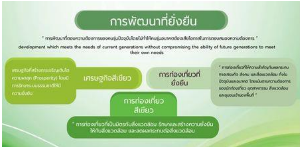
ภาพที่ 2.1 แนวคิดการพัฒนาที่ยั่งยืนสู่การท่องเที่ยวสีเขียว ที่มา: กระทรวงท่องเที่ยวและกีฬา (2560)

พัฒนาอุตสาหกรรมท่องเที่ยวที่ยั่งยืนจึงมีความสำคัญต่ออุตสาหกรรมท่องเที่ยวที่สอดคล้องต่อการจัดการท่องเที่ยวอย่างยั่งยืนได้แก่ การท่องเที่ยวโดยท้องถิ่น การท่องเที่ยวเชิงนิเวศ การท่องเที่ยวเชิงอนุรักษ์ท่องเที่ยวสีเขียว และ รวมถึงอุตสาหกรรมท่องเที่ยวที่เน้นด้านรักษาสิ่งแวดล้อม