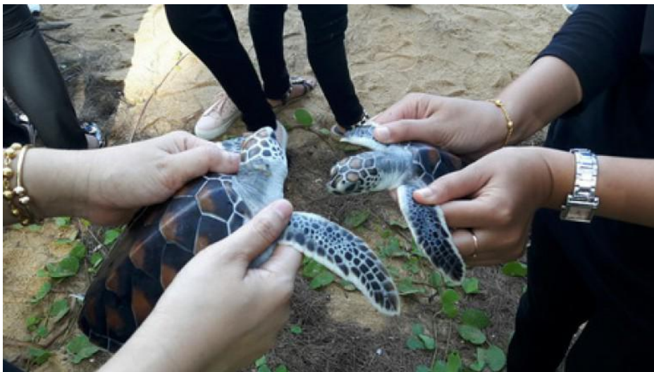
ภาพที่ 2.3 กิจกรรมปล่อยเต่าคืนสู่ธรรมชาติในพื้นที่หาดไม้ขาว จังหวัดภูเก็ต