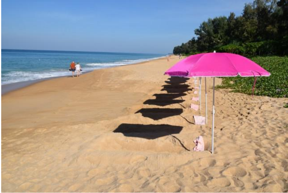
ภาพที่ 2.2 กิจกรรมสปาทรายบำบัดบริเวณชายหาดหาดไม้ขาว จังหวัดภูเก็ต