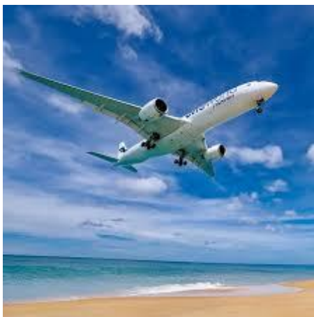
ภาพที่ 2.1 บริเวณหาดไม้ขาว จังหวัดภูเก็ต

หาดไม้ขาว จังหวัดภูเก็ต ตั้งอยู่ที่อำเภอถลาง จังหวัดภูเก็ต โดยหาดไม้ขาวห่างจากอำเภอถลางประมาณ 25 กิโลเมตร และห่างจากอำเภอเมือง ภูเก็ต ประมาณ 42 กิโลเมตร พื้นที่หาดไม้ขาว ตั้งอยู่บริเวณด้านเหนือสุดของเกาะภูเก็ต หาดไม้ขาวถือว่าเป็นชายหาดที่ยาวที่สุดในจังหวัดภูเก็ต ตลอดทั้งแนวของชายหาดจะเชื่อมต่อจากหาดในยางผ่านมาทางสนามบินตลอดจนสุดหาดทรายแก้ว ซึ่งนักท่องเที่ยวส่วนใหญ่ให้ความสนใจกับกิจกรรมการชมเครื่องบิน และถ่ายรูปชายหาดกับเครื่องบินเป็นอย่างมาก เนื่องจากชายหาดอื่นๆในจังหวัดภูเก็ตไม่สามารถถ่ายรูปเห็นเครื่องบินได้ นอกจากนี้นักท่องเที่ยวยังนิยมมาทำสปาทรายที่ชายหาดไม้ขาวอีกด้วย เนื่องจากเม็ดทรายในหาดไม้ขาว จังหวัดภูเก็ตเป็นเม็ดทรายที่ขาว ละเอียด และเป็นเม็ดทรายที่ช่วยในบำบัดการไหลเวียนโลหิตในร่างกายได้เป็นอย่างดี ไม่เพียงเท่านั้นหาดไม้ขาว จังหวัดภูเก็ตยังถือว่าเป็นแหล่งท่องเที่ยวทางธรรมชาติที่มีความอุดมสมบูรณ์เป็นอย่างมาก เนื่องจากเป็นแหล่งจักจั่นทะเลที่หายาก และเป็นแหล่งวางไข่ของเต่าทะเล ทำให้หาดไม้ขาว จังหวัดภูเก็ต ขึ้นชื่อเรื่องความอุดมสมบูรณ์ของแหล่งท่องเที่ยวทางธรรมชาติ