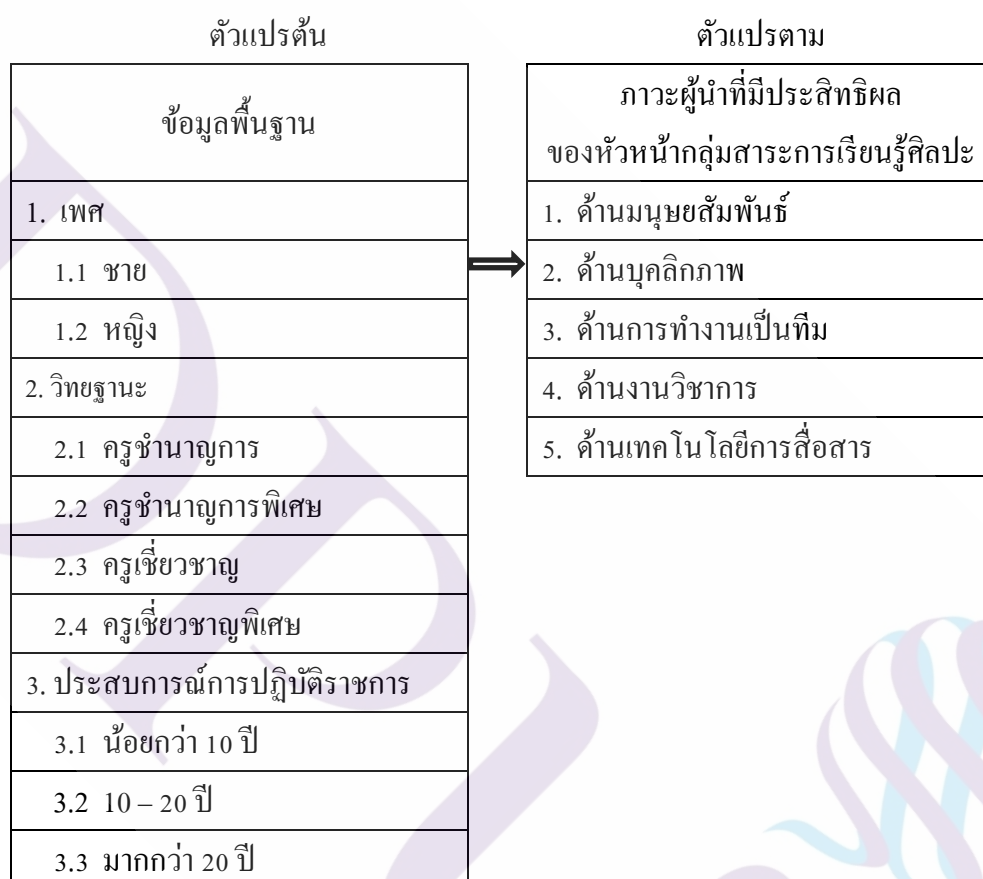
ภาพที่ 1.1 กรอบแนวคิดในการวิจัย

กรอบแนวคิดในการวิจัยครั้งนี้ ผู้วิจัยกำหนดกรอบแนวคิดในการวิจัยโดยใช้การตั้งเคราะห์จากแนวคิดของนักการศึกษาและงานวิจัยที่เกี่ยวข้องกับภาวะผู้นำที่มีประสิทธิผลของหัวหน้ากลุ่มสาระการเรียนรู้ศิลปะ สังกัดสำนักงานเขตพื้นที่การศึกษามัธยมศึกษา เขต 3 ดังนี้