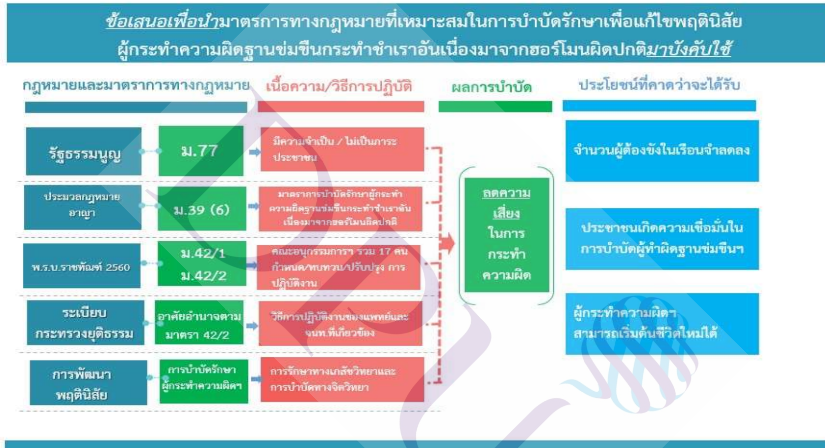
ภาพที่ 5.1 สรุปข้อเสนอแนะเพื่อนำมาตรการทางกฎหมายที่เหมาะสมในการบำบัดรักษาเพื่อแก้ไขพฤติกรรมผู้กระทำความผิดฐานข่มขืนกระทำชำเราอันเนื่องมาจากฮอร์โมนผิดปกติมาบังคับใช้