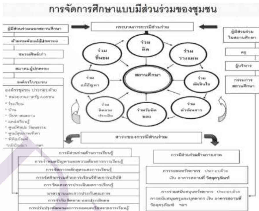
ภาพที่ 2.2 การจัดการเรียนรู้แบบมีส่วนร่วมของชุมชน