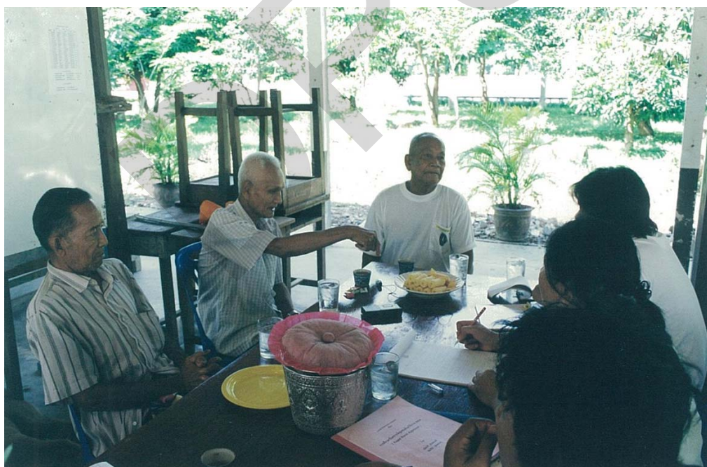
การสนทนากลุ่ม (Focus Group)