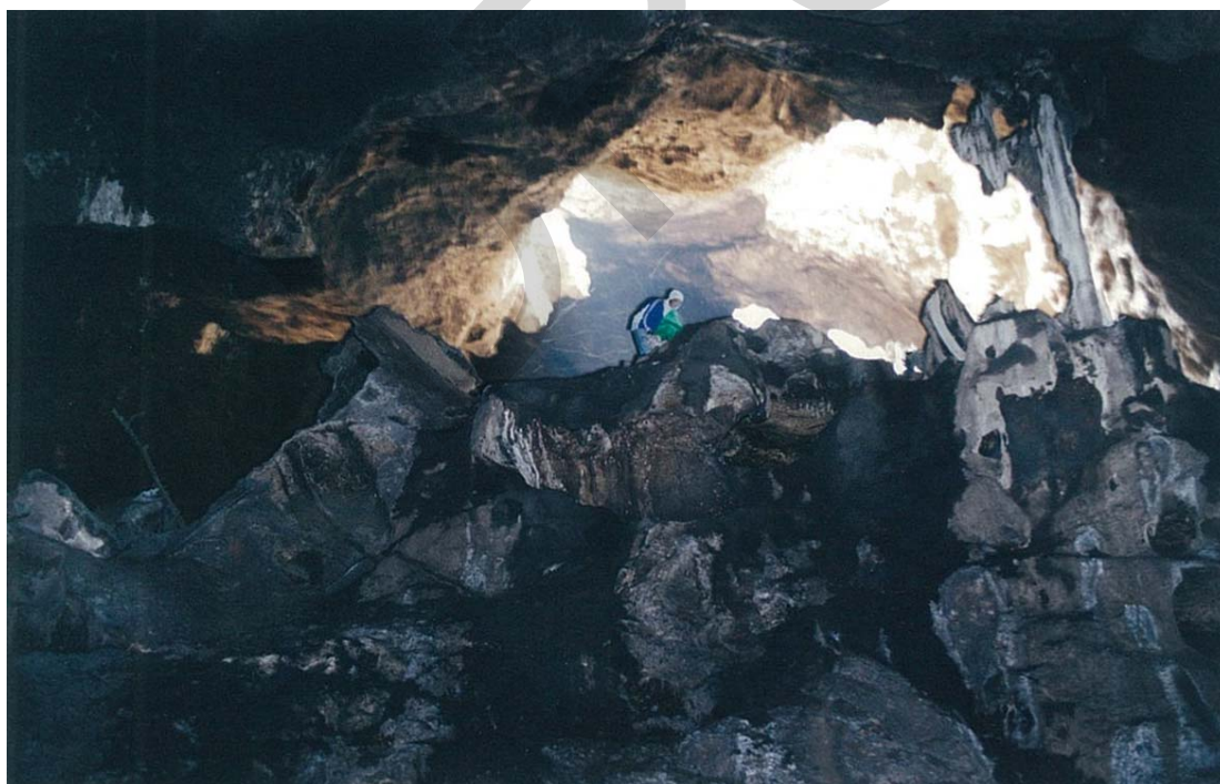
บรรยากาศบริเวณทางเข้าถ้ำและภายในถ้ำค้างคาววัดเขาช่องพราน