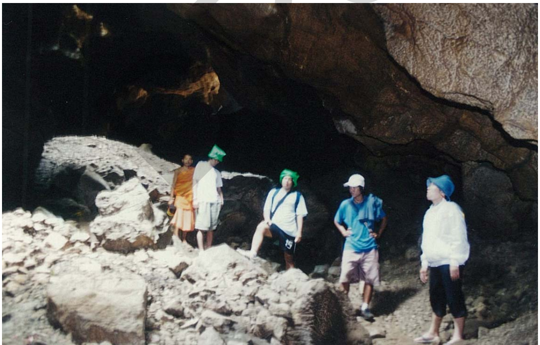
บรรยากาศบริเวณทางเข้าถ้ำและภายในถ้ำค้างคาววัดเขาช่องพราน