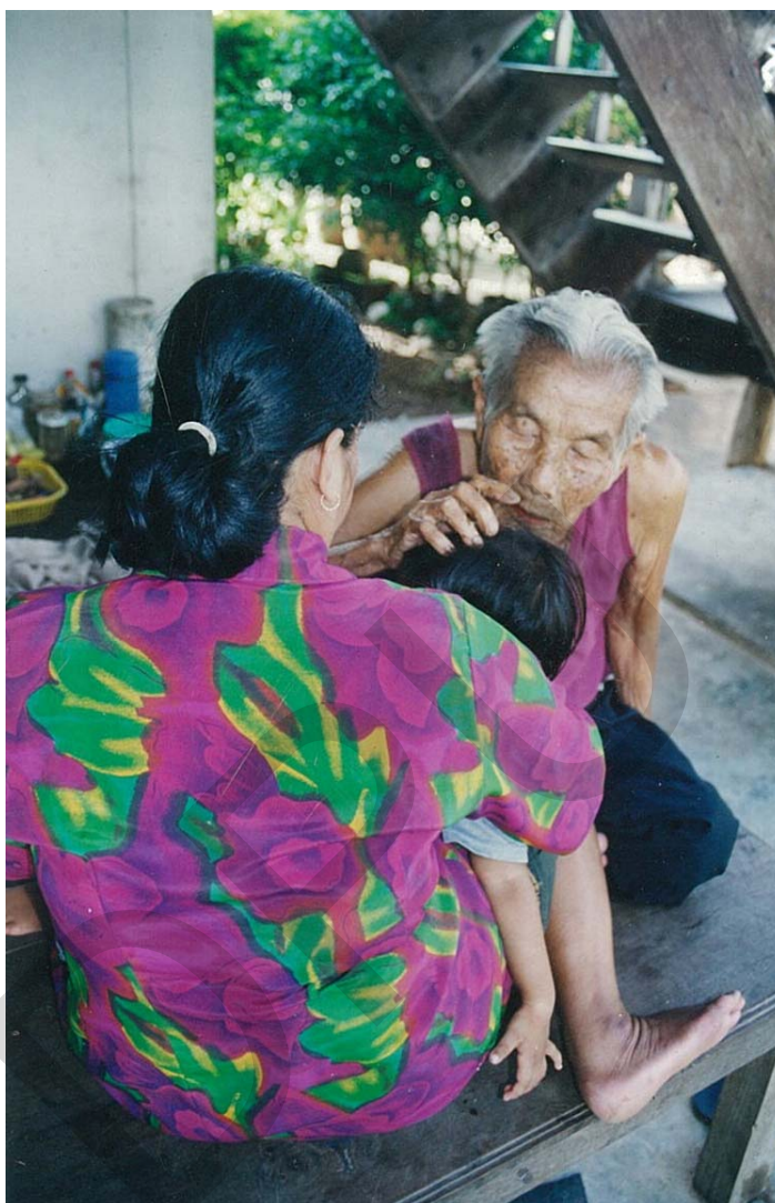
การรักษาโรคแบบภูมิปัญญาท้องถิ่นด้วยการกวาดยา