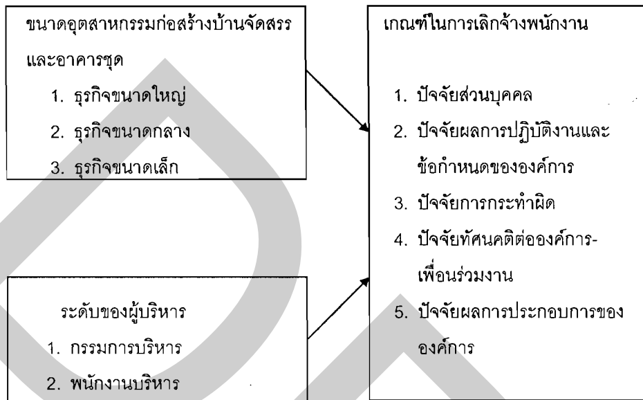
ภาพที่ 2 กรอบแนวคิดในการวิจัย