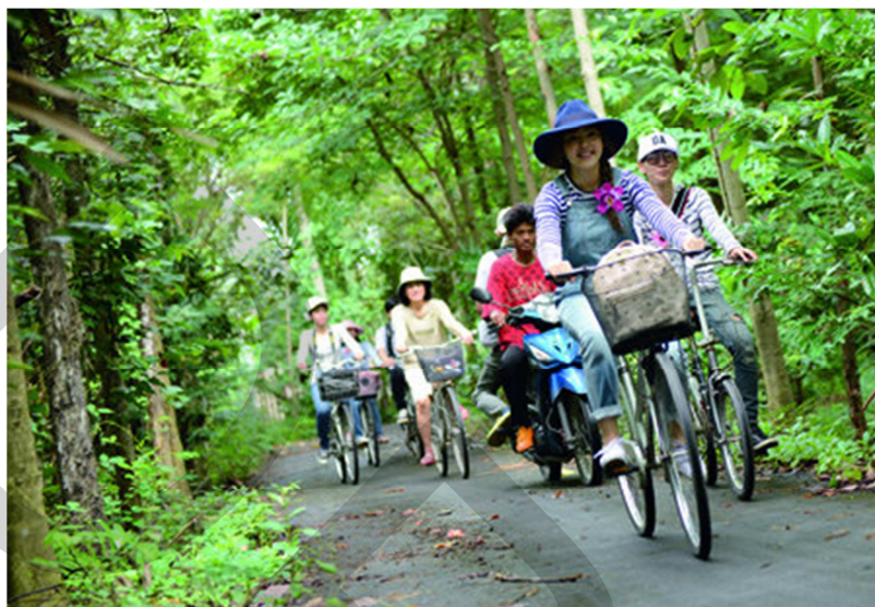
ภาพที่ 2.4 เส้นทางปั่นจักรยานสำหรับท่องเที่ยวในชุมชนบางกระเจ้า

สวยงาม ร่มรื่น มีพื้นที่เกษตรกรรมที่ยังคงความอุดมสมบูรณ์ โอกาสในการเรียนรู้และสัมผัสถึงวิถีชีวิตแบบชนบทที่แปลกแยกจากชีวิตเมืองเป็นเสน่ห์อย่างหนึ่งที่ทำให้พื้นที่บางกระเจ้าเป็นแหล่งท่องเที่ยวที่มีนักท่องเที่ยวเข้ามาอย่างต่อเนื่อง (ภาพที่ 2.4)