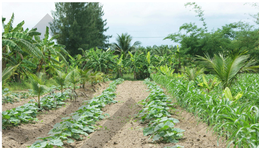
ภาพที่ 2.3 การเกษตรหมุนเวียน การเกษตรทฤษฎีใหม่ตามแนวพระราชดำรัส

อาชีพจนกระทั่งได้ เริ่มมีการส่งเสริมเรื่องการท่องเที่ยวเชิงอนุรักษ์ในพื้นที่ทำให้ เกิดรายได้ หมุนเวียนภายในพื้นที่ในแง่ของเศรษฐกิจ การเปลี่ยนแปลงดังกล่าวก็ดียิ่ง หากแต่รายได้ที่เกิดขึ้นยัง อยู่เฉพาะกลุ่มคน และยังไม่สามารถกลับมาฟื้นฟูจนเจือกับพื้นที่อันเป็นเอกลักษณ์ของบางกระเจ้า อย่างร่องสวนผลไม้ ได้อย่างแท้จริง