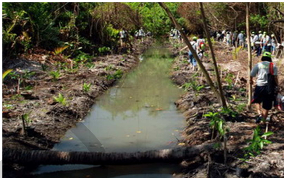
ภาพที่ 2.2 พื้นที่เกษตรกรรมเดิมที่รกร้าง