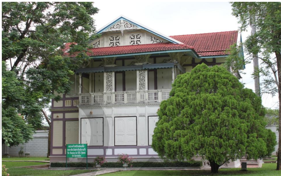
ภาพที่ 2.19 พระตำหนักสมเด็จพระศรีสวรินทิราบรมราชเทวี พระพันวัสสาอัยยิกาเจ้า

พระที่นั่งวิมานเมฆ พระราชวังดุสิต สำนักพระราชวัง (2546: 185) เป็นพระตำหนักแบบยุโรป ก่ออิฐถือปูน 2 ชั้น ชั้นบนมีห้องบรรทม 2 ห้อง ชั้นล่างมีห้องบรรทม 3 ห้อง และมีโถงกลางเช่นเดียวกับชั้นบน ด้านข้างของโถงกลางชั้นล่างมีบันไดขึ้นสู่ชั้นบน 2 ทางผนังอาคารทาสีไขไก่ ฝ้าขอบด้วยสีปูนแห้ง หน้าห้องโถงกลางชั้นบนมีระเบียง ประตูมุกทำเป็นรูปสี่เหลี่ยม 3 ประตู วงโค้งมุกระเบียง ประดับด้วยลวดลายกลิ้งไม้ ลวดลายเครือเถา