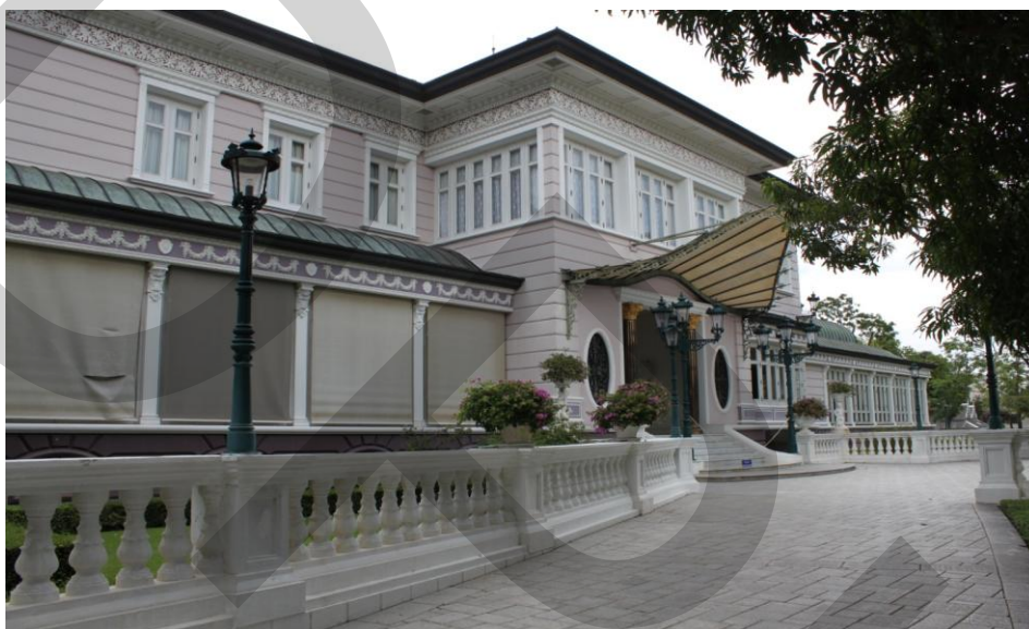
ภาพที่ 2.9 พระที่นั่งอุทยานภูมิเสถียร

พระที่นั่งวิมานเมฆ พระราชวังดุสิต สำนักพระราชวัง (2546: 108) ถือเป็นพระที่นั่งองค์ประธานของพระที่นั่งบางปะอิน ถ้ามองจากมุมสูงจะพบว่าถนนทุกเส้นทางในพระราชวังจะมุ่งสู่องค์พระที่นั่ง พระที่นั่งองค์นี้เดิมสร้างเป็นเรือนไม้สองชั้นแบบาสวิสชาเลต์มีเฉลียงหรือทางเดินที่เรียกว่า เวอแรนด้าโดยรอบ ทั้งชนบนและชั้นล่างทาสีเขียวอ่อนและสีเขียวแก่สลับกันภายในองค์พระที่นั่งตกแต่งแบบยุโรปด้วยเครื่องเรือนแบบฝรั่งเศสสมัยพระเจ้านโปเลียนที่ 3 กล่าวกันว่าเป็นเครื่องเรือนครบชุดที่ดีที่สุดในประเทศไทย ต่อมาพระบาทสมเด็จพระมงกุฎเกล้าเจ้าอยู่หัวได้มีการนำผ้าลูกไม้ผ้าแพรมาบุเครื่องเรือนชุดนี้เพื่อความสวยงาม