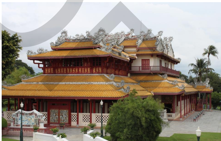
ภาพที่ 2.10 พระที่นั่งเวหาศน์จำรูญ

พระที่นั่งอุทยานภูมิเสถียรองค์ปัจจุบันมีสถาปัตยกรรมต่างจากพระที่นั่งองค์เดิมคือเป็นสถาปัตยกรรมแบบวิกตอเรียตัวอาคารเป็นคอนกรีตเสริมเหล็ก 2 ชั้น