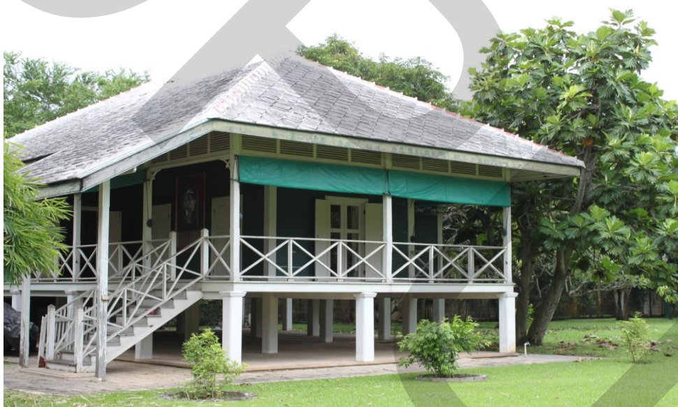
ภาพที่ 2.13 ตำหนักพระราชชายา เจ้าดารารัศมี

พระที่นั่งวิมานเมฆ พระราชวังดุสิต สำนักพระราชวัง (2546: 163) เป็นตำหนักไม้ยกพื้นชั้นเดียว มีระเบียงอยู่ด้านหน้า และด้านหลัง ตัวอาคารด้านนอกสีเขียว ด้านในทาสีขาว ประกอบด้วย ห้องบรรทม ห้องทรงพระตำราญ ห้องพระเครื่องต้น