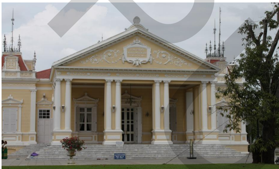
ภาพที่ 2.3 พระที่นั่งวโรภายพิมาน

พระที่นั่งไอศวรรย์องค์นี้เคยต้องอสณิบาดสองครั้ง สองสมัยคือ ในรัชสมัยของพระเจ้าปราสาททอง และในรัชสมัยของพระบาทสมเด็จพระจุลจอมเกล้าฯ ขณะนั้นได้เกิดพายุฝนตกหนักที่พระราชวังบางปะอินอสณิบาดได้คกยอดพระที่นั่งไอศวรรย์ทิพยอาสน์ ทำให้ยอดพระที่นั่งหักลงมาถึงลูกแก้วชั้นบนและเกิดเพลิงไหม้ลามตามคอสองชั้นล่างและเพดานด้านในต่อมาสมเด็จพระบรมราชาธิบดีได้จัดให้มีการซ่อมแซมพระที่นั่งให้ดีขึ้น