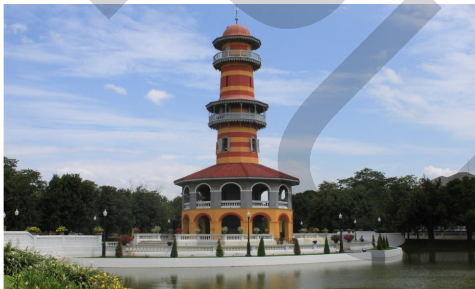
ภาพที่ 2.11 หอวิหุรทัสนา

พระที่นั่งเวหาศน์จำรูญเป็นพระที่นั่งที่แสดงถึงความเป็นพระปิยะมหาราช ของประชาชน ผู้อยู่ใต้ร่มพระบรมโพธิสมภารและเป็นพระที่นั่งที่แสดงออกถึงความจงรักภักดีของคนไทยเชื้อสายจีน ภายในพระที่นั่งเวหาศน์จำรูญมีห้องต่าง ๆ มากมายแต่ละห้องมีความสำคัญทางการศึกษาค้นคว้าเป็นอย่างยิ่งเช่น ห้องท้องพระโรงล่าง ห้องพระโรงบน ห้องบรรทมสมเด็จพระมงกุฎเกล้าเจ้าอยู่หัว ห้องลิฟท์ ห้องทรงพระอักษร ห้องพระป้า (ห้องพระวิมาน) เป็นที่ประดิษฐานพระป้าอักษรจีนจารึกตัวทองพระปรมาภิไธยพระบาทสมเด็จพระจอมเกล้าเจ้าอยู่หัว พระนามสมเด็จพระเทพศิรินทราบรมราชินี พระปรมาภิไธยพระบาทสมเด็จพระจุลจอมเกล้าเจ้าอยู่หัว และสมเด็จพระศรีพัชรินทราบรมราชินีนาถ ห้องพระบรรทมสมเด็จพระบรมราชินีนาถ ห้องพระบรรทมพระบาทสมเด็จพระจุลจอมเกล้าเจ้าอยู่หัว