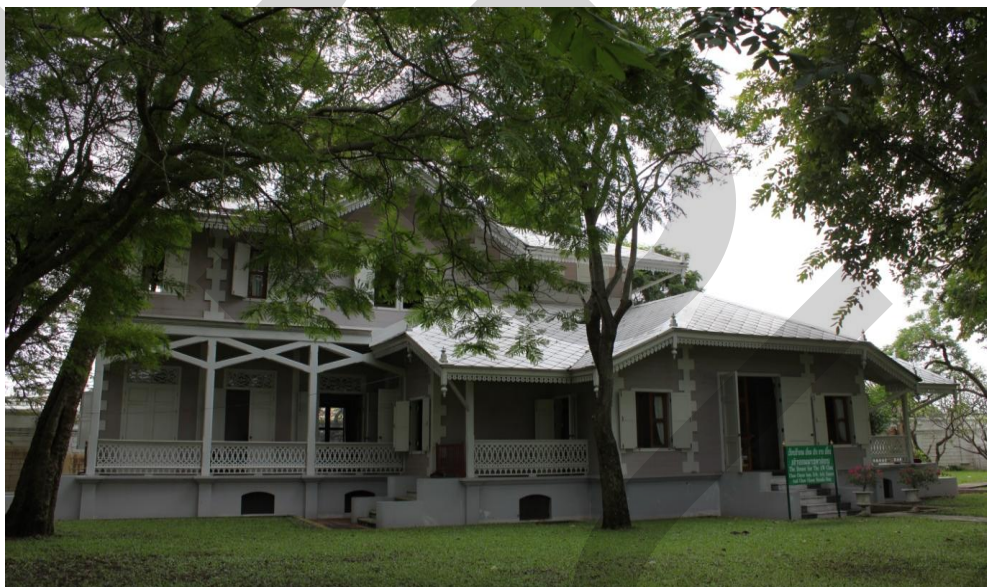
ภาพที่ 2.18 เรือนเจ้าจอม เอี่ยม เอิบ อาบ เอื่อนและเจ้าจอมมารดาอ่อน (เจ้าจอมก๊กอ้อ)

เจ้าจอมมารดาแสด เป็นธิดา พระยาอภัยนริศกามาตย์(ดิศ) มารดาของท่านคือ ข้าราชการบางเกิดเมื่อปีพุทธศักราช 2411 มีพระราชโอรส และพระราชธิดา 3 พระองค์ คือ พระเจ้าบรมวงศ์เธอพระองค์เจ้าเขจรจิระประดิษฐ์ พระเจ้าบรมวงศ์เธอพระองค์เจ้าอภัยนริศประสา และ พระเจ้าบรมวงศ์เธอพระองค์เจ้าทิพยาลังการ เจ้าจอมมารดาแสดถึงอสัญกรรม เมื่อปีพุทธศักราช 2468