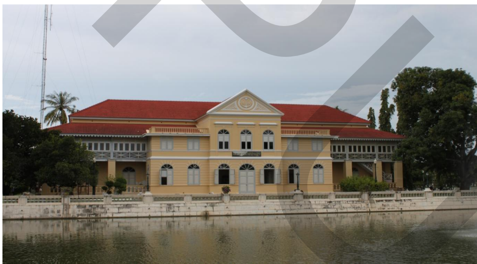
ภาพที่ 2.4 สถาปนาราชประยูร

พระที่นั่งวิมานเมฆ พระราชวังดุสิต สำนักพระราชวัง (2546: 75) เป็นอาคารตึก 2 ชั้น ศิลปะแบบโคโลเนียลตั้งอยู่ริมสระทางทิศตะวันตกของพระราชวังตรงข้ามกับหอเหมมณเฑียรเทวราช พระบาทสมเด็จพระจุลจอมเกล้าเจ้าอยู่หัวทรงพระกรุณาโปรดเกล้าฯ ให้สร้างขึ้นแล้วเสร็จในปีพุทธศักราช 2419 เพื่อพระราชทานแก่พระเจ้าน้องยาเธอฯ และสมเด็จพระเจ้าลูกยาเธอ เจ้าฟ้า