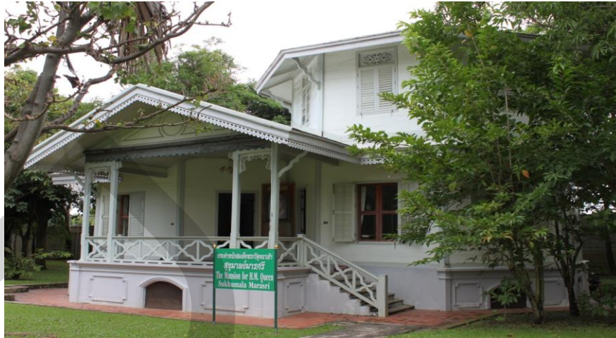
ภาพที่ 2.16 พระตำหนักพระปิตุจฉาเจ้าสุขุมลามารศรี พระอัครราชเทวี

พระที่นั่งวิมานเมฆ พระราชวังดุสิต สำนักพระราชวัง (2546: 175) เป็นตำหนักแบบยุโรป ชั้นล่างก่ออิฐถือปูนมีช่องลม ชั้นบนเป็นอาคารไม้ตัวอาคารประธานเป็นอาคาร 8 เหลี่ยม ประกอบด้วย ห้องบรรทม, ห้องทรง, ห้องตำราญพระอริยยาบถ