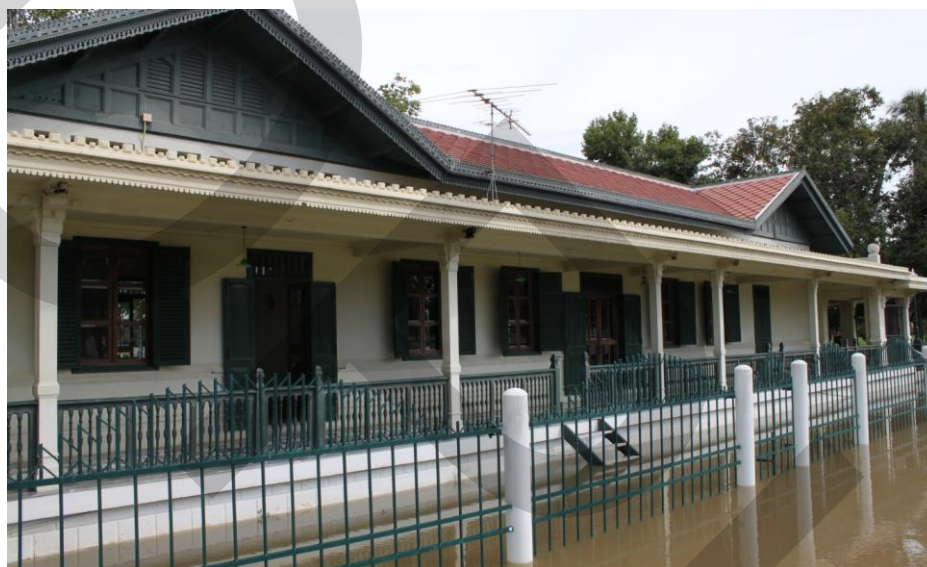
ภาพที่ 2.8 อาคารกัณฑ์ทหาร

พระที่นั่งวิมานเมฆ พระราชวังดุสิต สำนักพระราชวัง (2546: 97) สะพานตุ๊กตาเป็นสะพานที่พระบาทสมเด็จพระจุลจอมเกล้าเจ้าอยู่หัวทรงพระกรุณาโปรดเกล้าฯ ให้สร้างเลียนแบบสะพานข้ามแม่น้ำไทเบอร์ในกรุงโรม ประเทศอิตาลี บนราวสะพานทั้งสองข้างประดับตกแต่งด้วยตุ๊กตาปูนปั้นรูปเทพต่าง ๆ ของกรีก โดยทรงสั่งเข้ามาจากยุโรป ณ จุดนี้สามารถมองเห็นสถาปัตยกรรมของพระที่นั่งองค์ต่าง ๆ ของเขตพระราชฐานชั้นนอกได้โดยรอบ