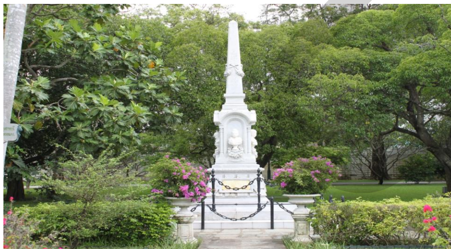
ภาพที่ 2.21 อนุสาวรีย์ราชานุสรณ์