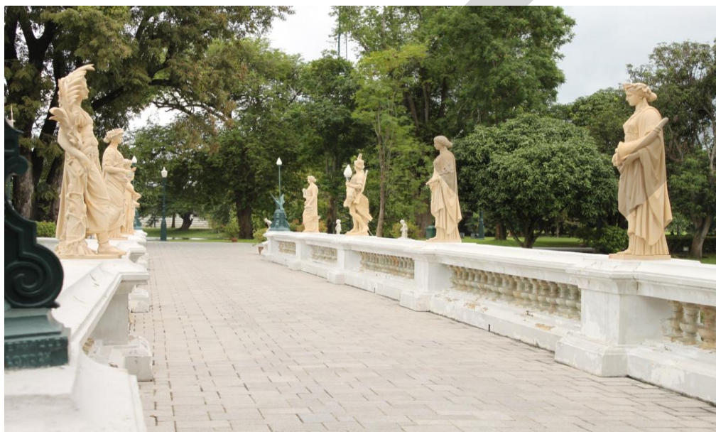
ภาพที่ 2.7 สะพานตุ๊กตา

พระที่นั่งวิมานเมฆ พระราชวังดุสิต สำนักพระราชวัง (2546: 91) กระจังมณฑลตั้งอยู่ทางทิศใต้ของพระที่นั่งไอศวรรย์ทิพยอาสน์รูปทรงแปดเหลี่ยมสร้างตามแบบสถาปัตยกรรมของประเทศสเปนใช้เป็นที่สำหรับทหารเป่าแตรถวายพระเกียรติในคราวเสด็จพระราชดำเนินในปัจจุบันเป็นจุดชมทัศนียภาพที่งดงามจุดหนึ่งในพระราชวังบางปะอิน