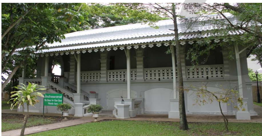
ภาพที่ 2.17 เรือนเจ้าจอมมารดาแสด

พระตำหนักพระปิตุจฉาเจ้าสุขุมลามารศรี พระอัครราชเทวี ทรงเป็นพระราชธิดาในพระบาทสมเด็จพระจอมเกล้าเจ้าอยู่หัว ประสูติแต่เจ้าจอมมารดาสำลี บุนนาค เมื่อวันที่ 10 พฤษภาคม 2404 พระอิสริยยศเริ่มแรกประสูติ คือ พระเจ้าลูกเธอ พระองค์เจ้าสุขุมลามารศรี ทรงพระประชวรด้วยโรคพระปัสสาวะ และสิ้นพระชนม์ที่วังบางขุนพรหม