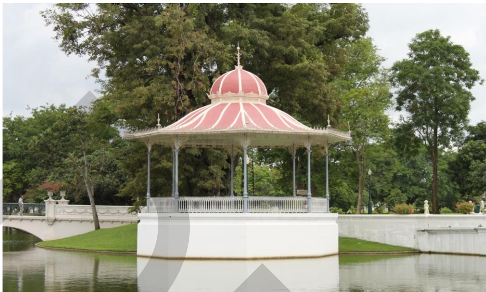
ภาพที่ 2.6 กระจังมณฑล

พระที่นั่งวิมานเมฆ พระราชวังดุสิต สำนักพระราชวัง (2546: 91) กระจังมณฑลตั้งอยู่ทางทิศใต้ของพระที่นั่งไอศวรรย์ทิพยอาสน์รูปทรงแปดเหลี่ยมสร้างตามแบบสถาปัตยกรรมของประเทศสเปนใช้เป็นที่สำหรับทหารเป่าแตรถวายพระเกียรติในคราวเสด็จพระราชดำเนินในปัจจุบันเป็นจุดชมทัศนียภาพที่งดงามจุดหนึ่งในพระราชวังบางปะอิน