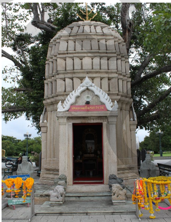
ภาพที่ 2.1 หอเหมมณเฑียรเทวราช (ศาลพระเจ้าปราสาททอง)