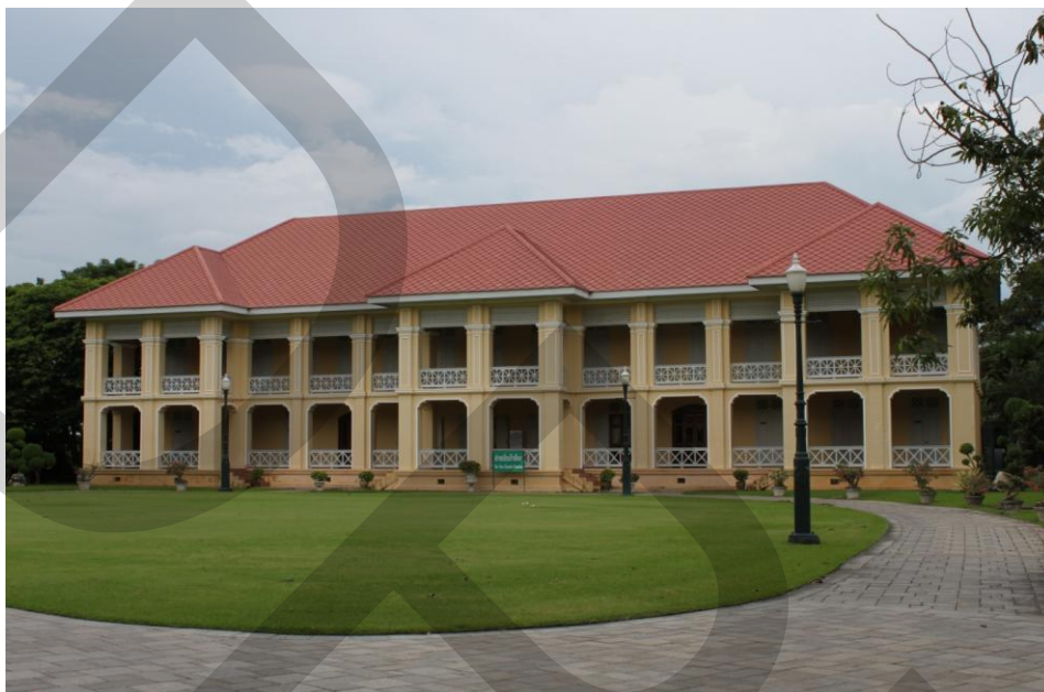
ภาพที่ 2.14 ตำหนักเก้าห้อง

2416 ได้ถวายตัวรับราชการฝ่ายในเป็นเจ้าจอมในพระบาทสมเด็จพระจุลจอมเกล้าเจ้าอยู่หัว ทรงมีพระราชธิดา 1 พระองค์ ทรงพระนามว่า พระเจ้าลูกเธอ พระองค์เจ้าวิมลนาคนพิลี ประชวร และสิ้นพระชนม์เมื่อพระชนมายุได้เพียง 4 พรรษา