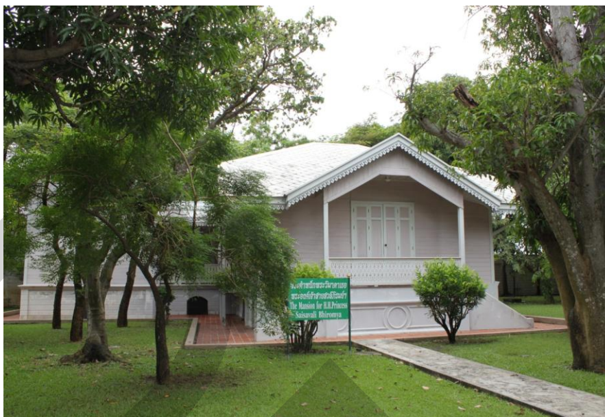
ภาพที่ 2.15 พระตำหนักพระวิมาดาเธอ พระองค์เจ้าสายสวลีภิรมย์ กรมพระสุทธาสินีนาฏ ปิยมหาราชปดิวรัดา

พระที่นั่งวิมานเมฆ พระราชวังดุสิต สำนักพระราชวัง (2546: 171) เป็นอาคารแบบยุโรปก่ออิฐถือปูน ตัวอาคารประธานมี 2 ชั้น ประกอบด้วย ห้องบรรทม ห้องทรงพระตำราญ ห้องทรง โดยมีระเบียงเล็ก ๆ เชื่อมรอบอาคารมีลวดลายประดับเป็นลวดลายขนมปังจิงจี้ด้านหน้ามีมุขระเบียง และบันไดทางขึ้น 2 ข้าง