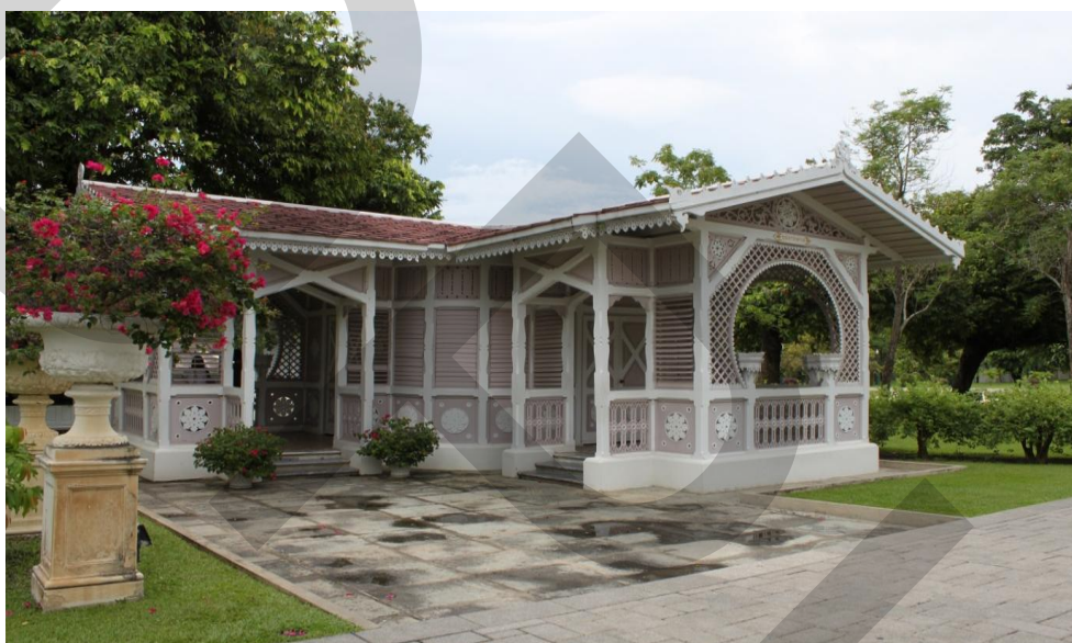
ภาพที่ 2.12 เก๋งบุปผาประพาส

พุทธศักราช 2424 ลักษณะเป็นหอสูง 3 ชั้น 12 เหลี่ยม มีความสูง 30 เมตร ยอดหอคลุมด้วยหลังคา รูปครึ่งวงกลม ภายในมีบันไดเวียนขึ้นไปสู่ชั้นบน 112 ชั้น เป็นสถาปัตยกรรมผสมผสานแบบยุโรป ตัวอาคารทาสีแดงและเหลืองสลับกัน สร้างขึ้นเพื่อใช้เป็นสถานที่ทอดพระเนตร โขลงช้างป่า และ ภูมิประเทศโดยรอบพระราชวังบางปะอิน จากการมองเห็นทัศนียภาพที่งดงามได้โดยรอบบน หอคิวุฑูรที่ศานนี้เอง จึงมีคำกล่าวว่ “ดูนาที่ไหนดเ่า ไม่เ่าที่บางปะอิน”