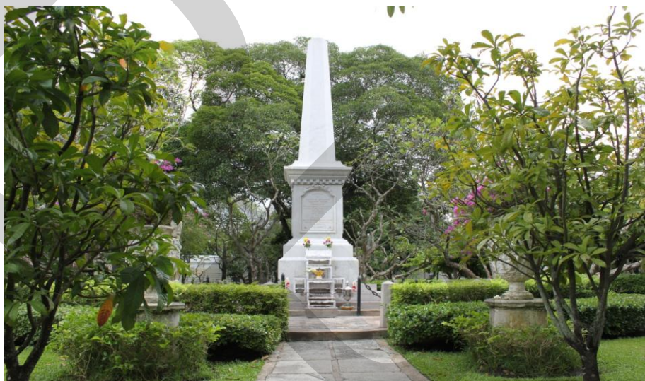
ภาพที่ 2.20 อนุสาวรีย์สมเด็จพระนางเจ้าสุนันทากุมารีรัตน์

สมเด็จพระศรีสวรินทิราบรมราชเทวี พระพันวัสสาอัยยิกาเจ้า เสด็จสวรรคตในรัชกาล ปัจจุบัน เมื่อวันที่ 17 ธันวาคม พุทธศักราช 2498 พระชนมายุ 93 พรรษา