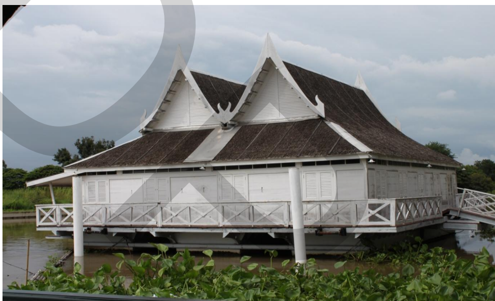
ภาพที่ 2.5 เรือนแพพระที่นั่ง

มหาวิชฌนหิศ พร้อมเจ้านายฝ่ายหน้าใช้เป็นที่ประทับคราวแปรพระราชฐานมาประทับ ณ พระราชวังบางปะอิน วันที่ 13 กันยายน 2444 ทรงพระกรุณาโปรดเกล้าฯ ให้ตั้งสำนักงานที่ดินกรุงเทพฯ เป็นแห่งแรกในประเทศไทยเรียกชื่อว่า “หอทะเบียนเมืองกรุงเทพฯ” โดยใช้สภาคารราชประยูรเป็นที่ทำการในช่วงสงครามโลกครั้งที่ 2 ใช้เป็นที่พำนักของเจ้านายหลายพระองค์รวมทั้ง นายปรีดี พนมยงค์ ผู้สำเร็จราชการแทนพระองค์พระบาทสมเด็จพระเจ้าอยู่หัวอานันทมหิดล