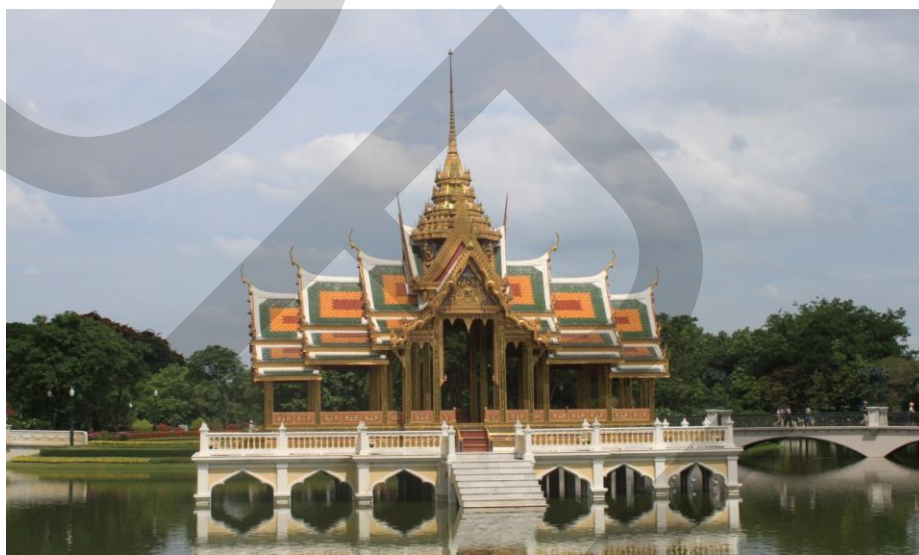
ภาพที่ 2.2 พระที่นั่งไอศวรรย์ทิพยอาสน์

พระที่นั่งวิมานเมฆ พระราชวังดุสิต สำนักพระราชวัง (2546: 40) หอเหมมณเฑียรเทวราชเป็นที่ประดิษฐานเทวรูปพระเจ้าปราสาททองบางคนเรียกกันว่า “ศาลพระเจ้าปราสาททอง” พระบาทสมเด็จพระจอมเกล้าเจ้าอยู่หัว ทรงพระกรุณาโปรดเกล้าฯ ให้สร้างขึ้นในระหว่างปี พุทธศักราช 2415 – 2419 เนื่องจากเกิดเหตุการณ์พระประเทียบล่มเมื่อปีพุทธศักราช 2423 เป็นเหตุให้สมเด็จพระนางเจ้าสุนันทากุมารีรัตน์สวรรคตกลางแม่น้ำเจ้าพระยาพร้อมพระราชธิดา พระบาทสมเด็จพระจอมเกล้าเจ้าอยู่หัวทรงพระราชวิตกว่า ถ้าสมเด็จพระเจ้าลูกยาเธอเจ้าฟ้ามหาวชิรมุกขิพลอดภัยจากเหตุการณ์ครั้งนี้จะทรงสร้างศาลถวาย