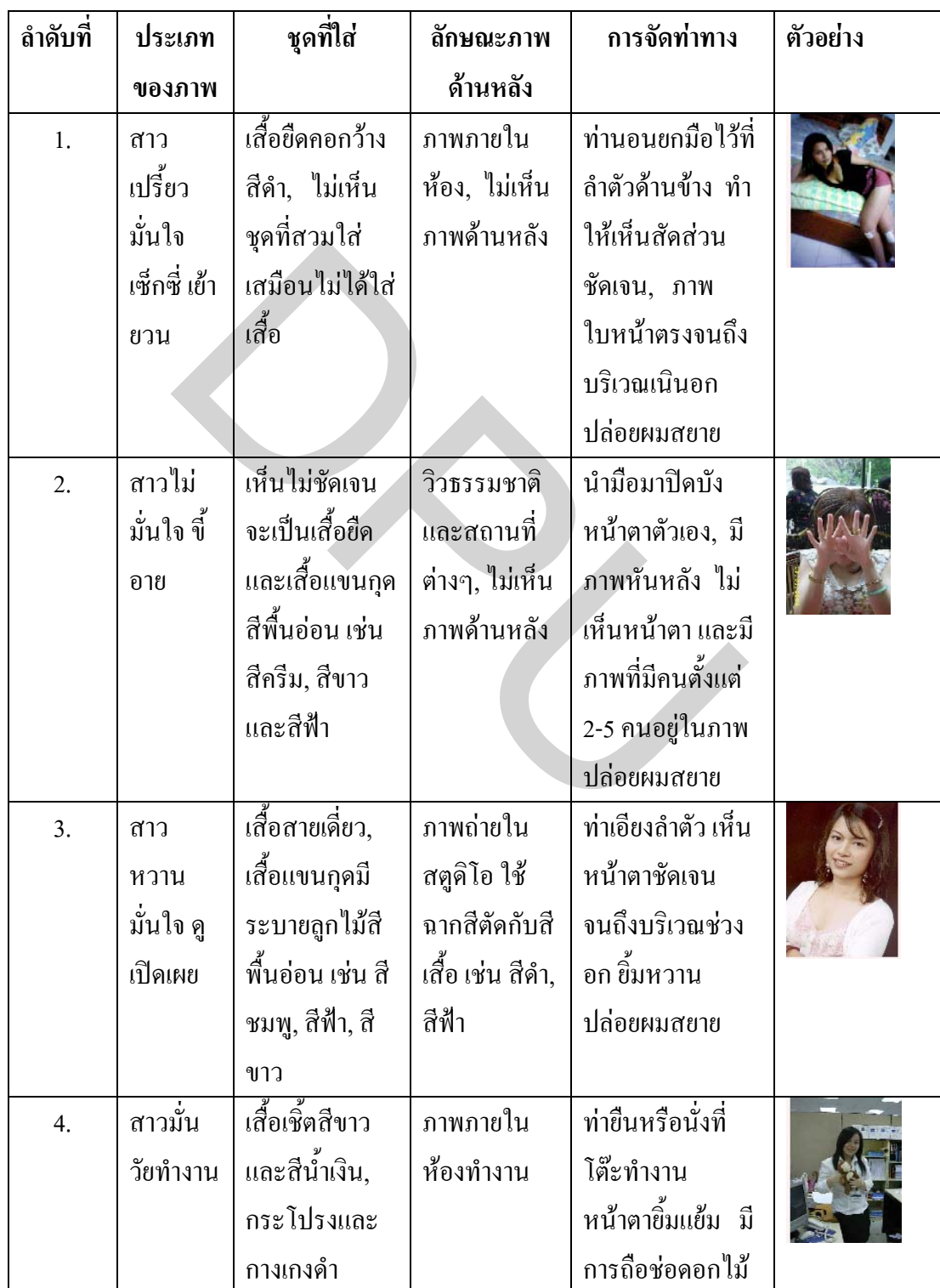
ตารางที่ 1 แสดงประเภทของภาพที่สมาชิกนำเสนอเพื่อแสดงตัวตนใน www.thaimate.com