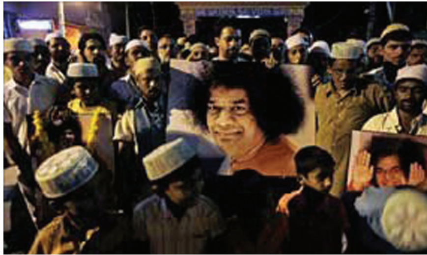
มากมาย ก็จะได้พรดังประสงค์

ก่อน ค.ศ.2006 ตอนที่มิสสุภาพท่านแข่ง แรง จะออกมาเดินรับแขกที่มากันวันละ ไม่ต่ำกว่า 30,000 คน ณ สถานที่ซึ่งสร้างขึ้น มาตั้งแต่ ค.ศ.1948 ดังมีชื่อเรียกว่า Prasanthi Nilayam (Temple of Peace) ผู้คนจาก นานาชาติและคนอินเดียจะคอยหมอบอยู่ ริมทางเดินให้ได้มีโอกาสสัมผัสท่าน