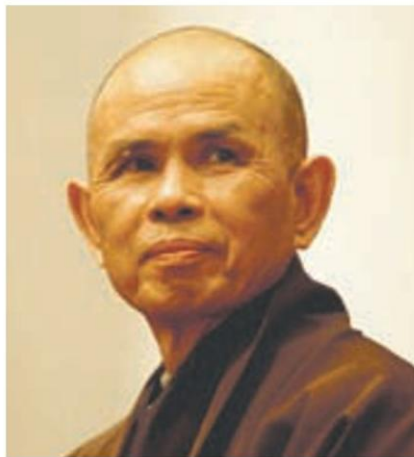
Thich Nhat Hanh

Village Monastery ในฝรั่งเศส ขณะนี้กำลังพักฟื้นหลังจากที่เส้นโลหิตในสมองแตกกระตุบรุนแรงโดยบัดนี้มีอาการดีขึ้นเป็นลำดับ